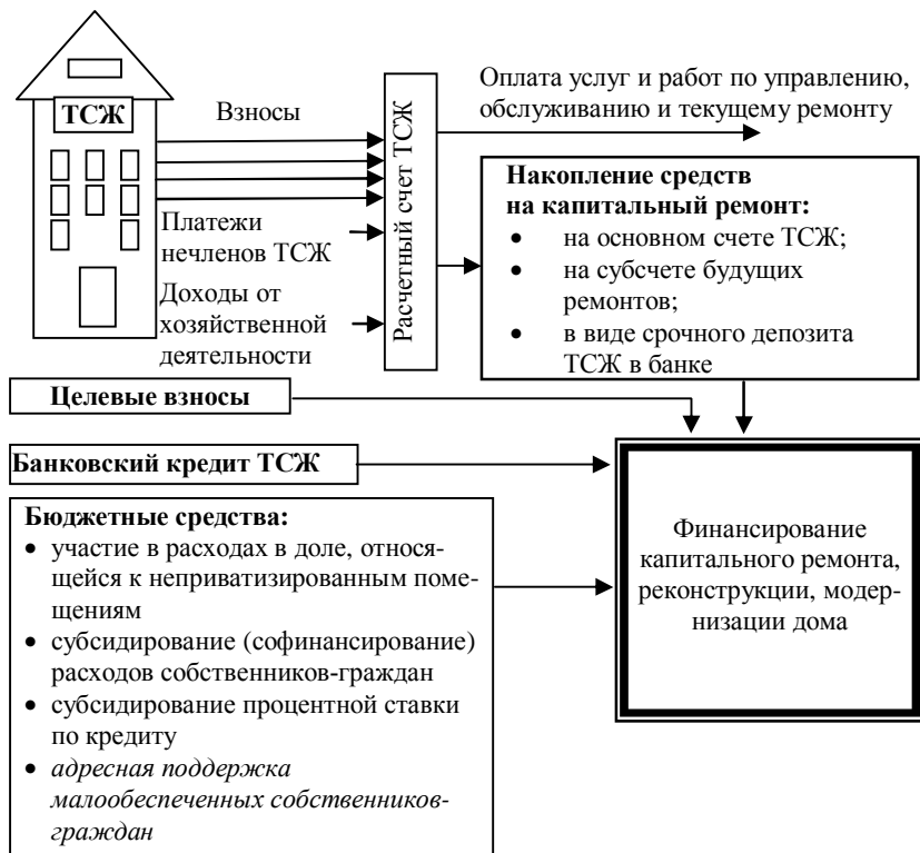
Рисунок 1. Финансирование капитального ремонта многоквартирного дома, в котором создано ТСЖ